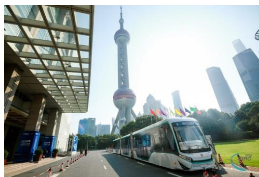
中车浦镇 DRT 数字列车亮相